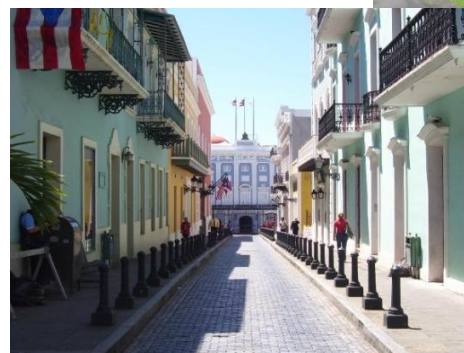
San Juan