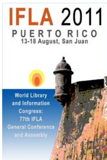
Utrdba San Felipe del Morro

Svetovni kongres Mednarodne zveze bibliotekarskih društev in ustanov ( IFLA ) (Puerto Rico, San Juan, 13. – 18. avgust 2011)